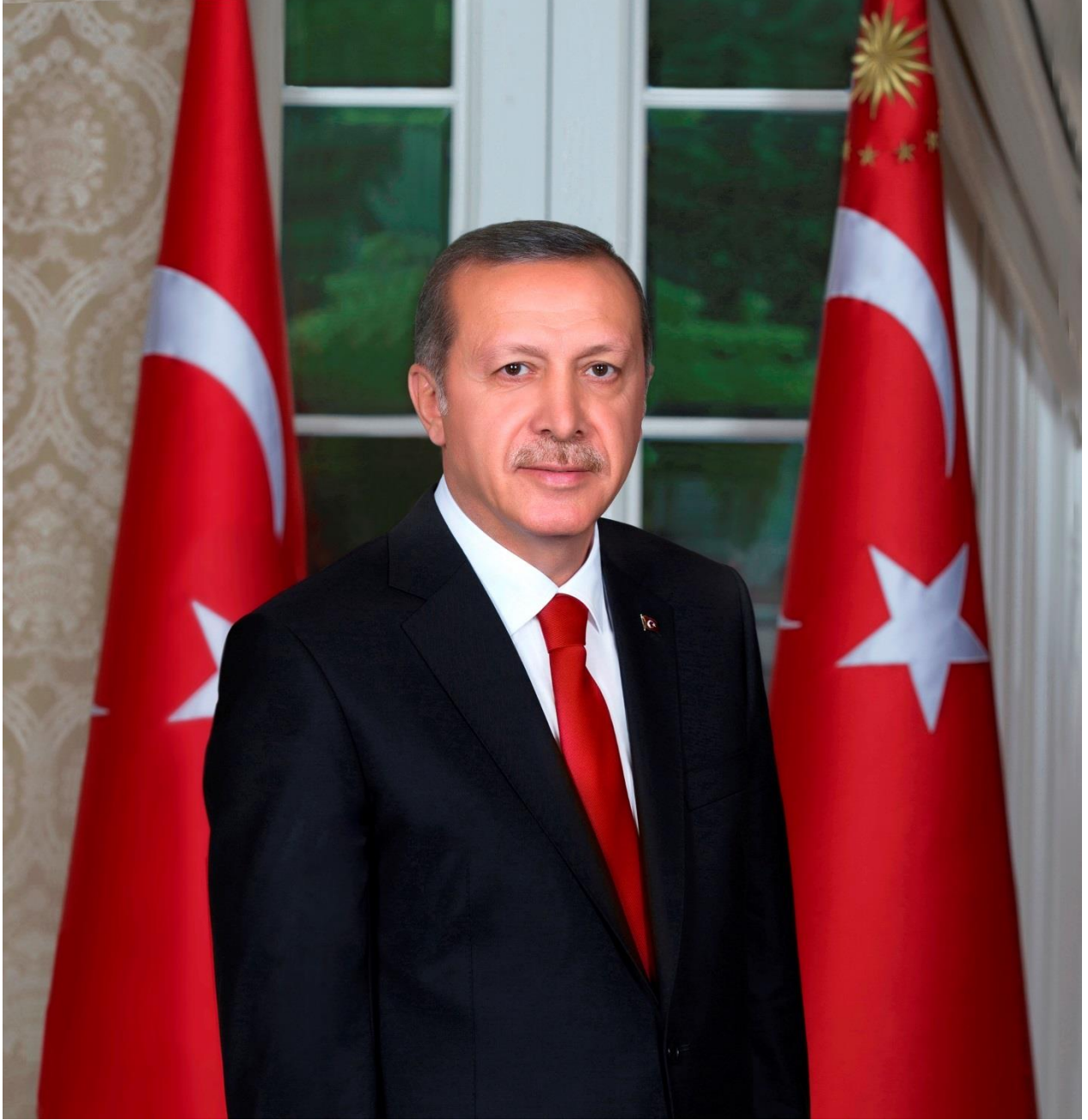
Recep Tayyip ERDOĞAN CUMHURBAŞKANI