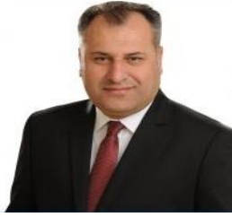
Üzeyir KIZILSEKİ Belediye Başkanı