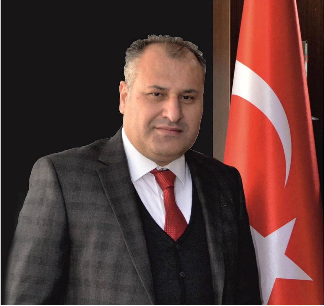
Üzeyir KIZILSEKİ Çağlayancerit Belediye Başkanı